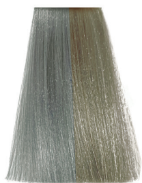
9.11 very light ash blonde