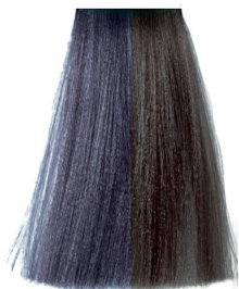
8.22 light violet blonde