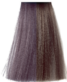
8.21 light blond ash violet