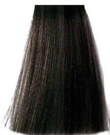
5.2 light brown violet