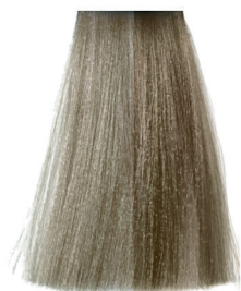
9.0 very light natural blonde