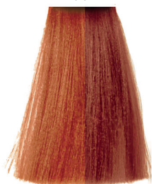
8.44 light blonde copper