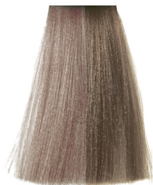
9.2 very light lavender blonde