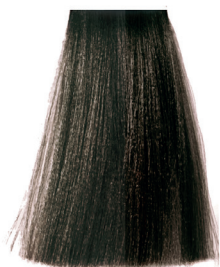
6.0 natural dark blonde