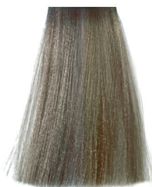
7.71 cold blonde ash