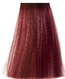
7.66 intense red blonde