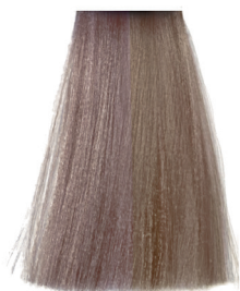
9.32 very light golden pearl blonde